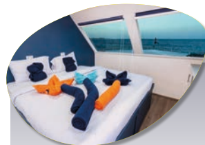
Cabine Pont supérieur seaview 180 En option : + 80 € par personne