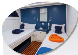
Cabine Standard Inclus dans le tarif