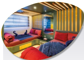
Cabine Standard Inclus dans le tarif