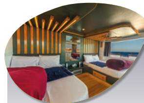
Cabine Pont supérieur seaview 180 En option : + 150 € par personne