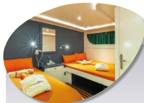
Cabine Pont supérieur En option : + 50 € par personne