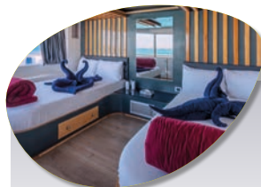
Cabine Pont supérieur En option : + 100 € par personne